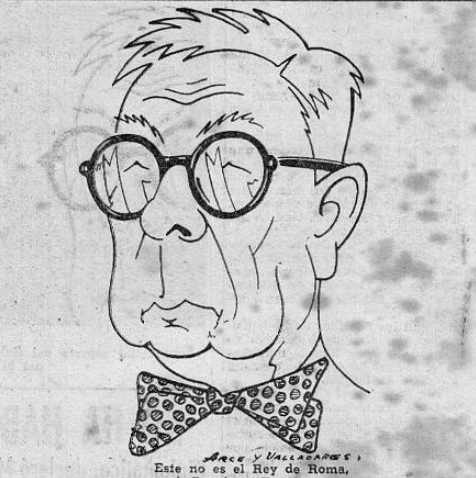
Este mes es el Rey de Roma, pero sí, Román y Reyes.

Todavía no se han dado a conocer los nombres de las personas q' en representación de Nicaragua asistirán a la toma de posesión del