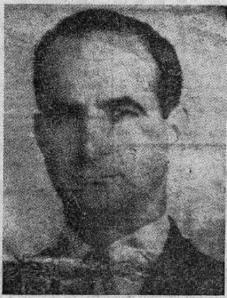
General José Figueres F., Presidente de la Junta Fundadora de la Segunda Republica de Costa Rica

La Empresa de EL GRAN DIARIO LA NACION se honra en publicar las expresivas frases que con respecto a la labor que viene desarrollando este periódico, tuviere el señor José Figueres Ferrer, Presidente de la Junta Fundadora de la Segunda Republica de Costa Rica, manifestadas en el siguiente cablegrama que recibimos: