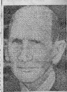
"El hombre providencial que fué don Pepe por iluminación y gracia de su espíritu, no ha debido partir en diez el derecho de disposición de la suerte de su pueblo; ha debido guiarlo él solo..."

los señores Figueres y Ulate al triunfar la revolución.