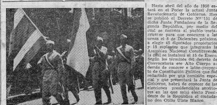
Marcial aspecto del Colegio Seminario en el desfile del 31 de agosto.